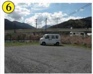
6 太閤橋下駐車場所(左岸)