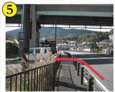
5 お塔坂駐車場所入口(左岸) 現在工事中で工事完了後は入口が50m移動します。