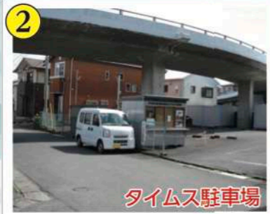
2 タイムズ駐車場 早川漁協販売所(右岸)(有料)