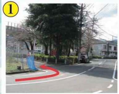
1 南板橋公園入口(左岸)