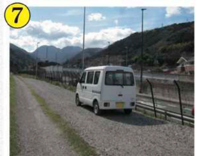
7 大堰堤付近駐車場所(左岸)

2024年度の年間遊漁券の有効期間は、 2024/01/01~2024/12/31まで。