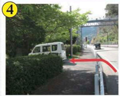
4 小田原用水駐車場所入口(左岸)